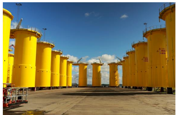
2 Foto: TP'er fra Bladt Industries.

Underleverandørerne af henholdsvis monopæle og overgangsstykker sejler stålkonstruktionerne til en havn på den jyske vestkyst på store havgående pramme. Her laster