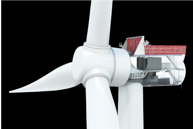
1 Foto: Direct Drive vindmølle. Grafik: Siemens Gamesa.

Teknologien erstatter både et stort tandhjul og lejer i de traditionelle gear. Det gør konstruktionen enklere og mindre tung. Desuden undgår man de meget høje omkostninger, som en eventuel udskiftning af en gearkasse medfører.